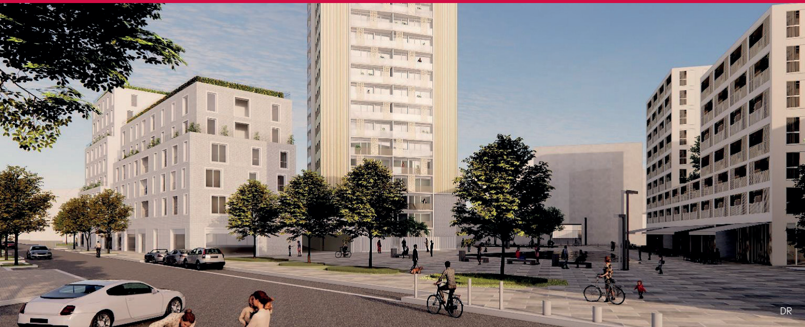
Vue de l'avenue Lénine sur la Tour A et la future allée Joséphine Baker

La nouvelle Municipalité a lancé dès sa prise de fonction en juillet 2020 un travail d'analyse complet du projet de Renouvellement Urbain du quartier Youri-Gagarine avec les services de la Ville et d'Est Ensemble pour déterminer une nouvelle feuille de route pour le projet.