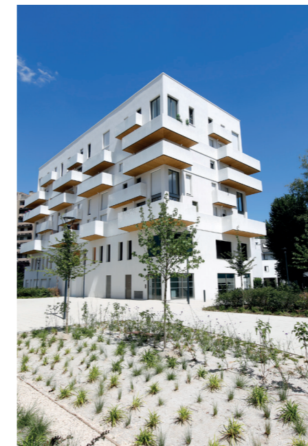
Le lot 4 et les noues paysagères de l'allée Joséphine Baker.

Ainsi en janvier 2022, trois scénarios ont été présentés proposant différentes hypothèses de démolitions et de créations d'espaces publics, formes et positionnements d'immeubles. Sur cette base et à la demande des membres du comité de pilotage