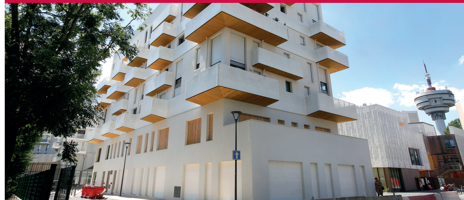
Les habitants du lot 3 ont emménagé au printemps 2022, juste avant la livraison des espaces publics situés devant l'école Maryse Bastié.

L e quartier Youri-Gagarine fait l'objet d'un projet de renouvellement urbain porté par la ville de Romainville et Est Ensemble dont l'objectif est d'améliorer durablement la qualité de vie des habitants. Initié en 2016 par l'ancienne municipalité, ce projet urbain a été gelé pour partie en 2020 par la nouvelle municipalité pour en permettre une réorientation qui répondrait avant tout aux besoins des habitants du quartier. Cette réorientation menée avec et pour les habitants porte ses fruits et devrait aboutir en septembre 2022 au choix du scénario définitif d'aménagement.