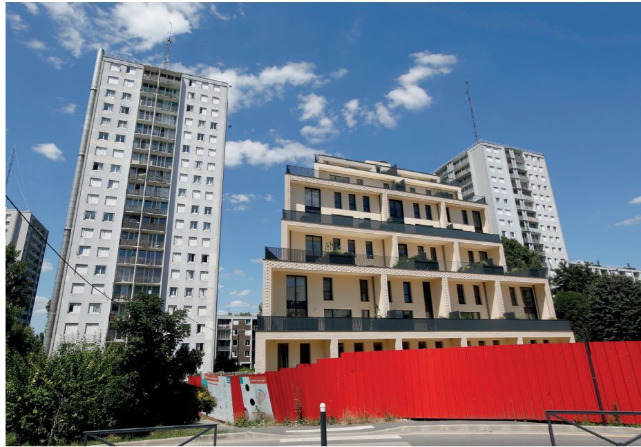
Devant les tours G et I, le lot 5 qui devrait être livré au 2 e semestre 2022.

L'enquête sociale menée entre juillet et septembre 2021 par le cabinet Le FRENE mandaté par Seine-Saint-Denis Habitat a révélé qu'il serait nécessaire de réaliser dans le quartier 481 logements répartis comme suit, entre 198 et 355 réhabilitations de logements sociaux et entre 126 et 283 logements sociaux neufs, pour rendre effectif le « droit au choix ».