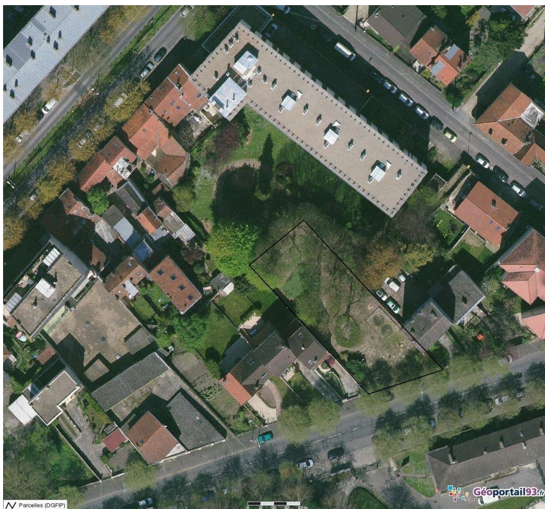
Image satellite avec localisation du site

Opération d'aménagement dans lequel s'inscrit ce site : La Ville prévoit une concertation avec les Noiséen.e.s afin de définir les prochains usages de la parcelle. Par ailleurs, le site est inscrit au « Plan squares » qui prévoit la requalification à court/moyen terme du patrimoine d'espaces publics verts au sein de la Ville.