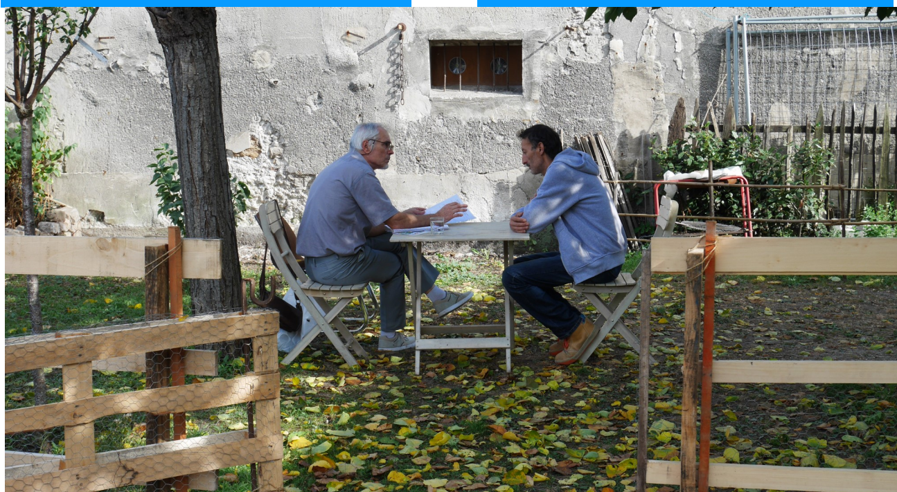
LVP Interim avec un salarié en insertion au sein de la Ferme Caillard, Octobre 2018