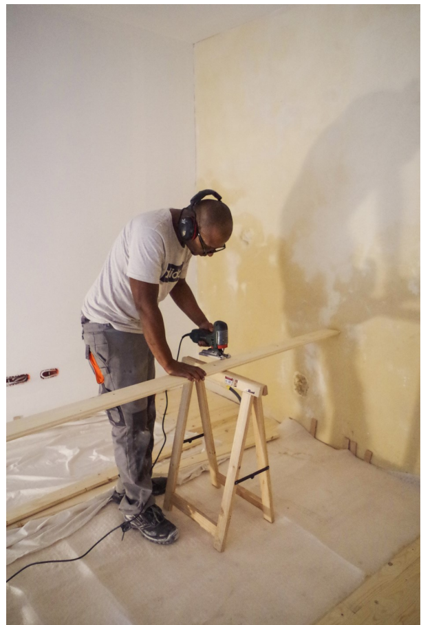
Salarié en insertion sur la Ferme Caillard, Été 2018

La forfaitisation à partir d'un budget prévisionnel est notamment obligatoire pour les projets présentant un montant total d'aide publique inférieur ou égal à 50.000 euros.