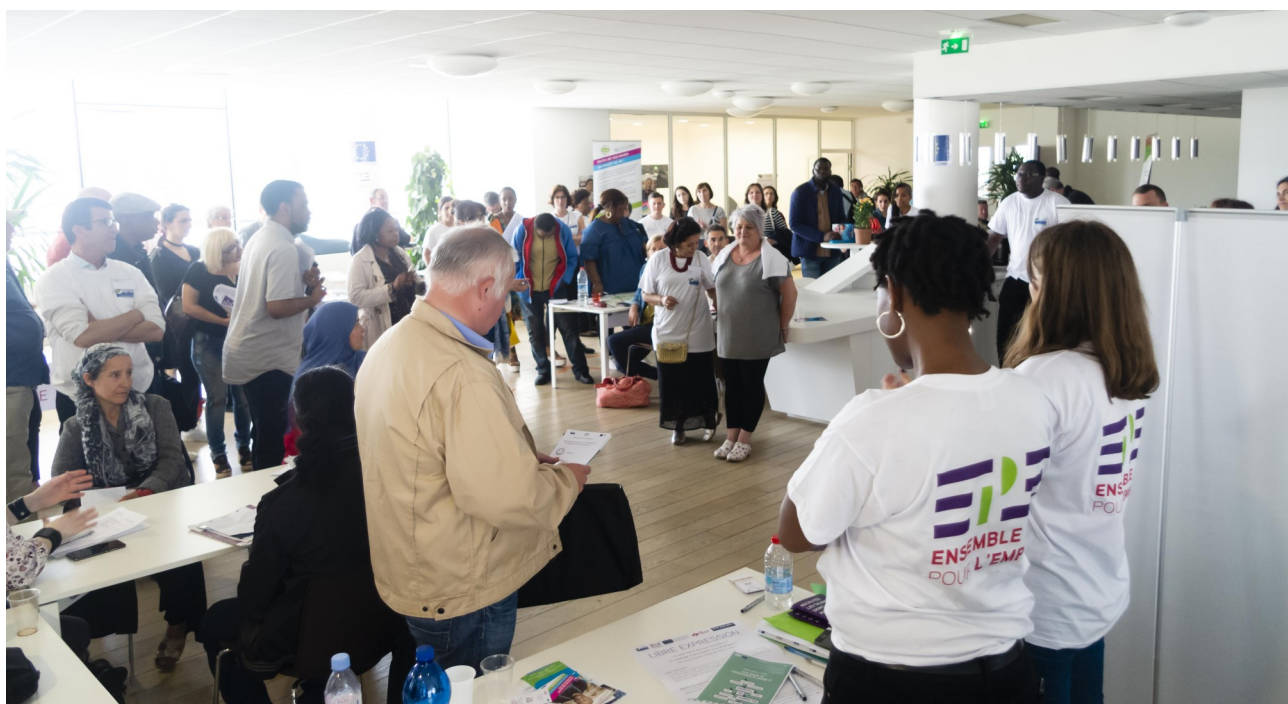
Forum des participants du PLIE, Juin 2018