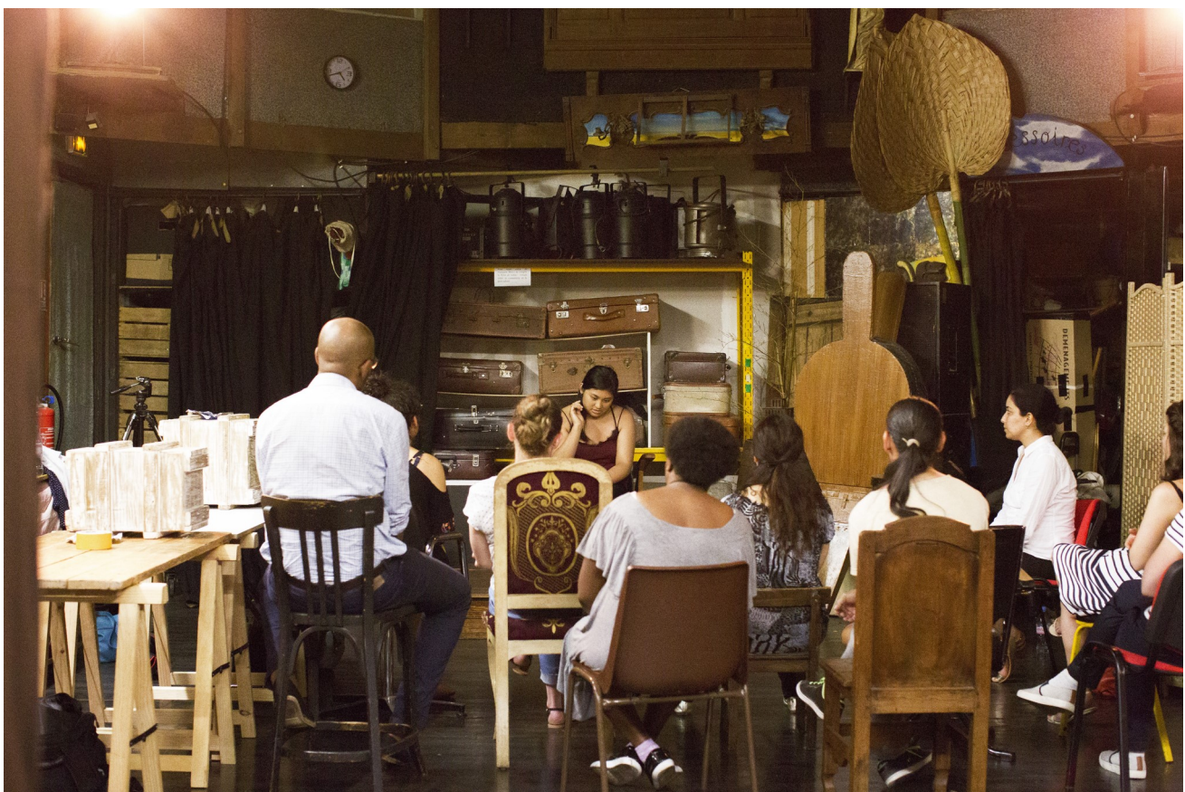
Action « Maitrise de la langue française à travers les outils du théâtre et du conte », Communic'arte, 2017