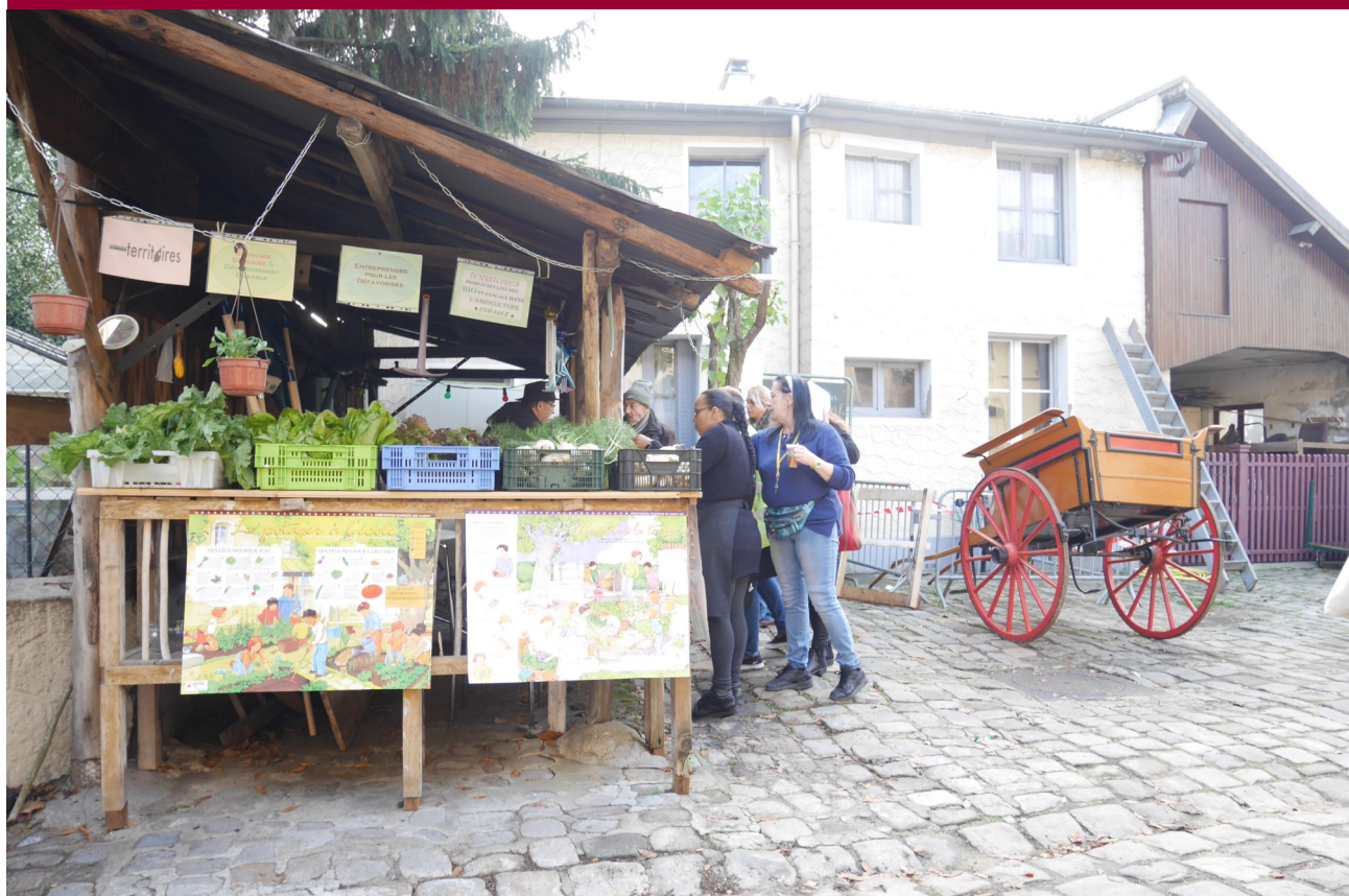
Paysan Urbain et Territoires au sein de la Ferme Caillard, lors de l'évènement « Les femmes et l'IAE », Novembre 2018

Volet communication : cf. notice Modalités de communication sur le financement du FSE, en direction des participants et des partenaires.