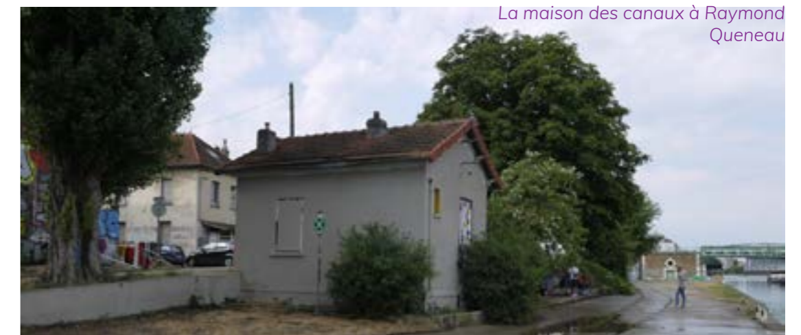
La maison des canaux à Raymond Queneau

L'occupation des maisons en meulière des garages à bennes de la Ville de Paris permettrait de mettre en valeur ce patrimoine et de faire vivre l'avenue Gaston Roussel. Les participants proposent l'installation d'une épicerie solidaire ou en vrac qui vend des produits frais. L'association le marché sur l'eau qui transporte des fruits et légumes par bateau sur le canal de l'Ourcq pourrait faire escale à Raymond Queneau pour alimenter cette épicerie en circuit court . L'installation de ce type de programme ou d'un magasin biologique ne souffrirait pas de la concurrence avec les enseignes de restauration ou l'éventuelle grande surface qui pourrait s'installer dans le Paddock car cette offre est totalement absente sur le quartier. Les participants proposent également d'y installer des artistes ou des artisans locaux actuellement en recherche de locaux.