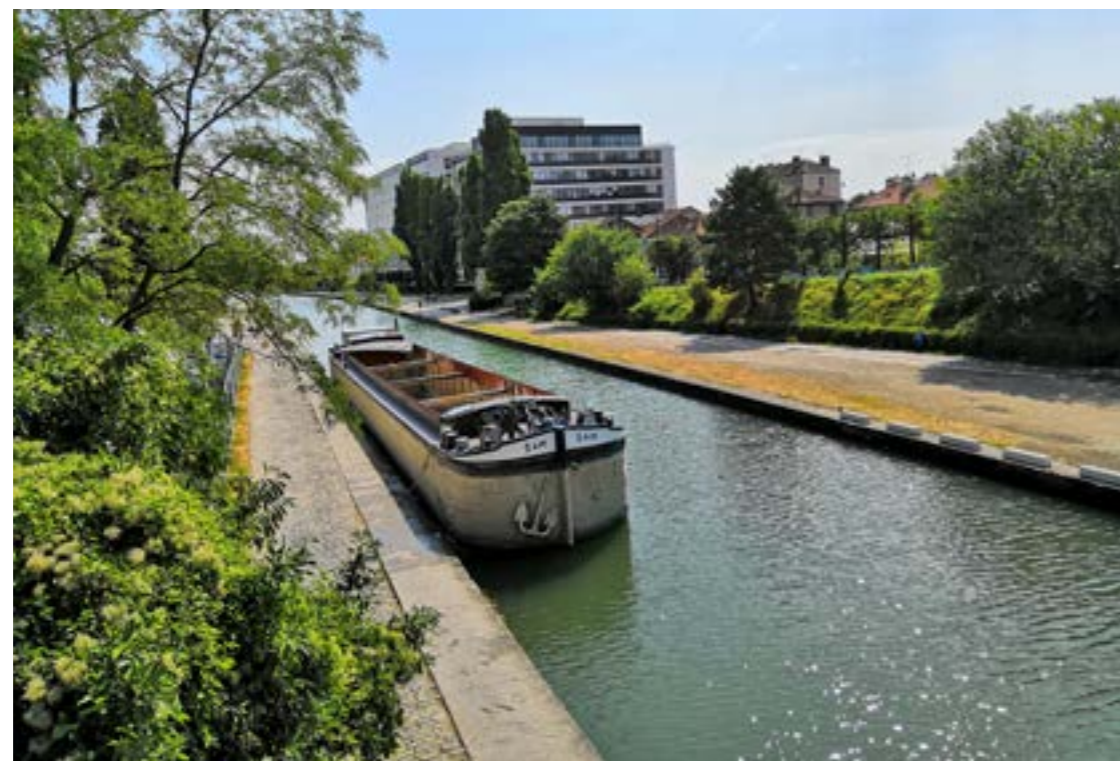
Canal de l'Ourcq,

Il faut faire revivre le canal. On doit changer tout ça, c'est à nous de le faire.