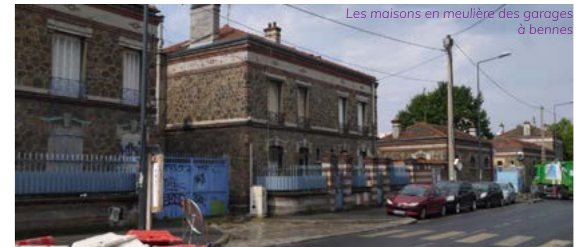
Les maisons en meulière des garages à bennes