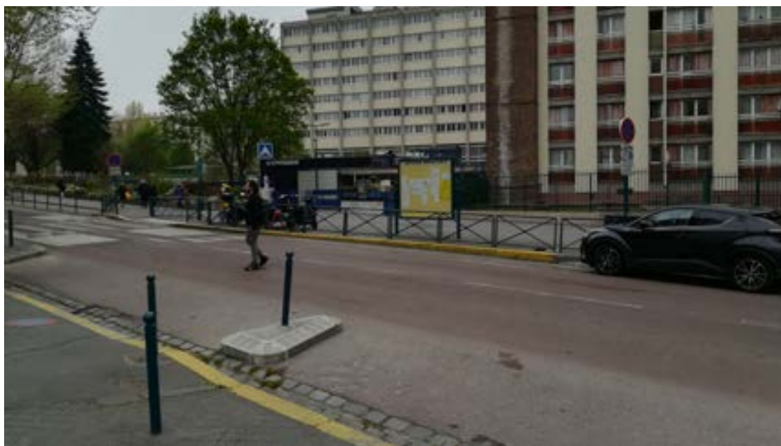
Avenue Anatole France

Un parking à vélos abrité et sécurisé pourrait être installé sur le triangle non utilisé devant la boulangerie du métro, en complément de la station Velib. L'espacement des arceaux devra empêcher le stationnement des deux-roues motorisés sur cet espace.