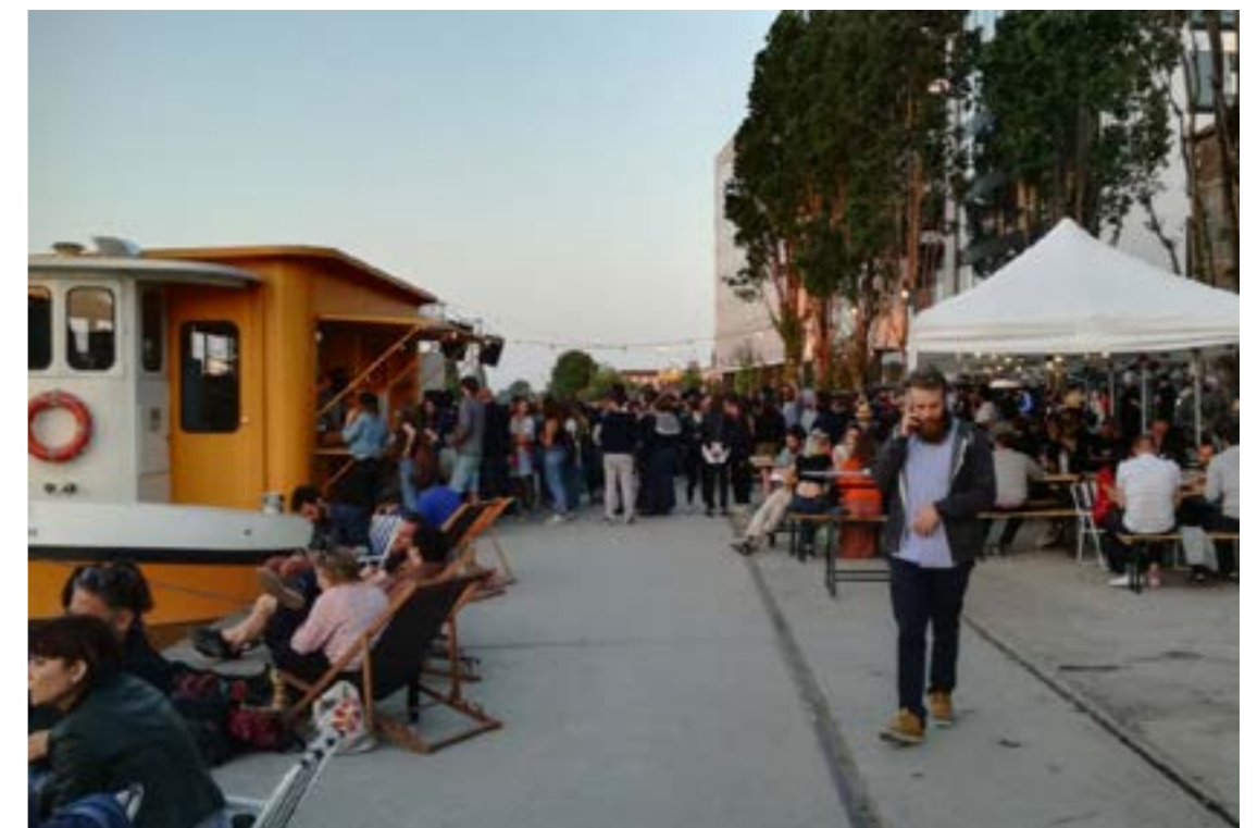
Le Barboteur à Raymond Queneau

Le bâtiment des canaux pourrait s'ouvrir pour favoriser un passage vers le canal . Les participants proposent de garder tout le matériel qui s'y trouve et le donner à voir pour conserver « le charme du lieu ». Ils proposent également d'ouvrir le bâtiment aux artisans locaux et d'organiser des ateliers pédagogiques, des expositions , ou bien d'y installer un fab lab ou une ressourcerie pour apprendre à réparer les objets.