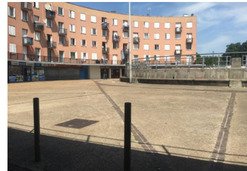
«La place des Nations Unies est fermée sur elle-même»