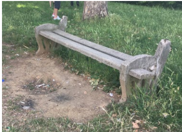
«Absence de mobilier ou ruines»