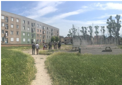
«Beyrouth, c'est désert»