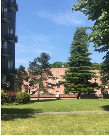
«Un parc vert avec de beaux arbres»