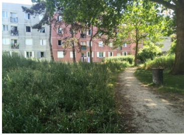
«Des espaces abandonnés»