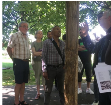
«Attaquer l'écorce par les chiens, c'est tuer l'arbre»