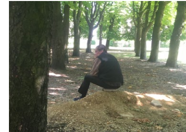
«Absence de mobilier et d'éclairage»