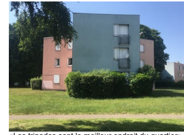
«Les tripodes sont le meilleur endroit du quartier»