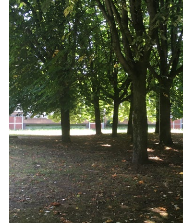
«Arbres denses, hall murés, c'est sombre et enclavé»