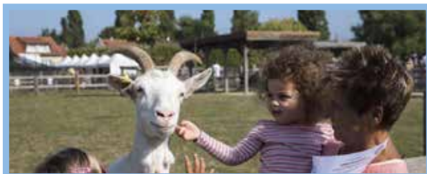
La Ferme urbaine de Rosny-sous-Bois