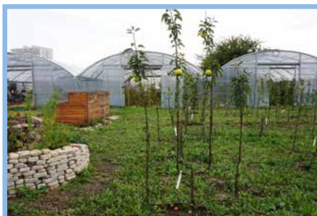
La ferme des possibles à Stains