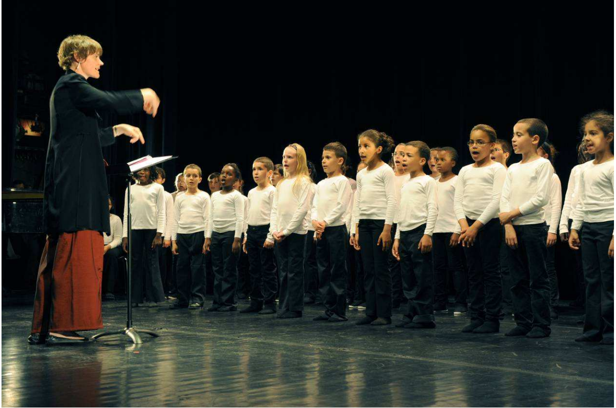
La pré-maîtrise de Radio France.