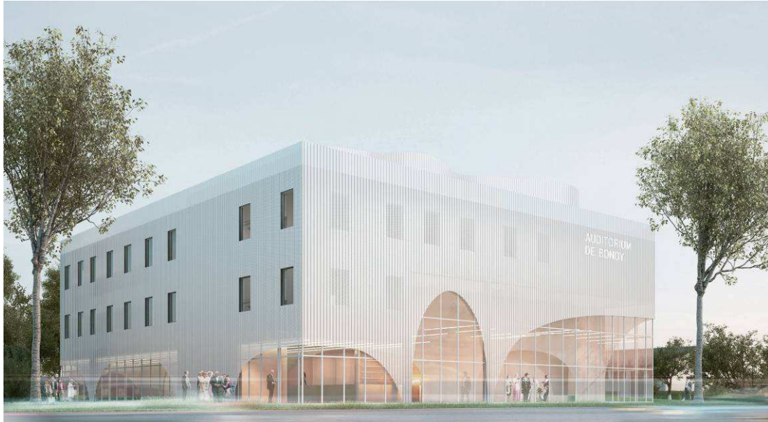
Perspective d'architecte, façade entrée principale de l'auditorium. ©Parc Architecte