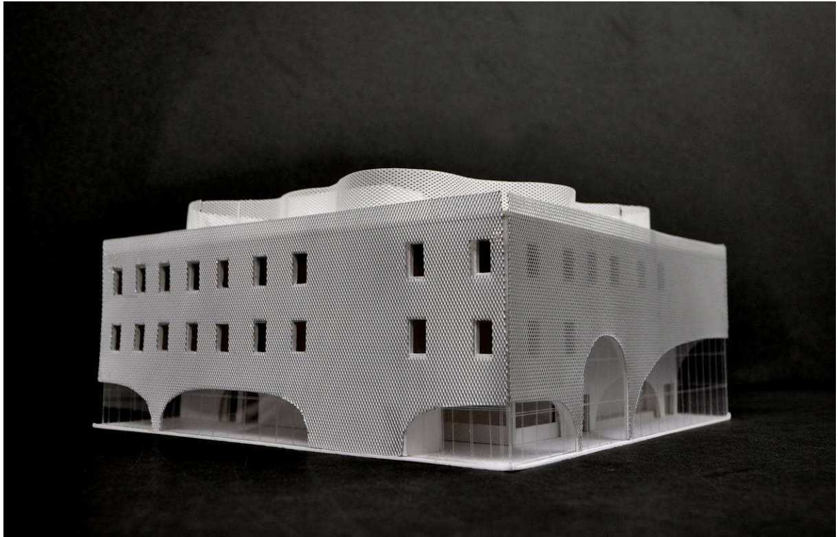
Image de synthèse, façade entrée principale de l'auditorium. ©Parc Architecte