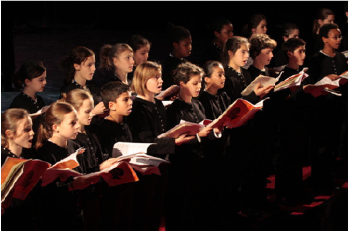
La maîtrise de Radio France. ©Maurice Partouche