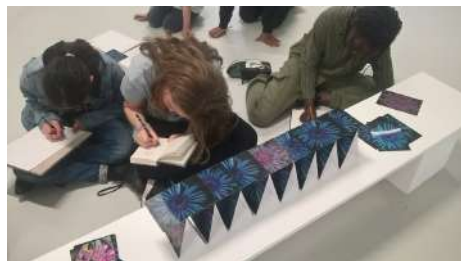
← frac ↑ île-de-france ↓

>> Dès 3 ans Du 07/05/2025 au 28/05/2025