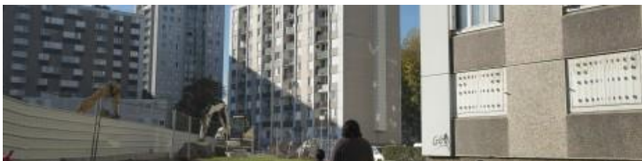
Le Projet de Renouvellement Urbain Yuri Gagarine à Romainville

Est Ensemble est l'objet de nombreuses mutations urbaines, ce dont témoignent les projets d'aménagement comme les 12 quartiers en renouvellement urbain. Une expérimentation sur la déconstruction-performante et le réemploi des matériaux issus de la démolition a été lancée sur le quartier Gagarine à Romainville. En parallèle, une vaste étude de métabolisme urbain appliquée aux matériaux du BTP a été réalisée, permettant d'identifier les potentiels de matériaux disponibles dans les bâtiments à démolir sur le territoire.