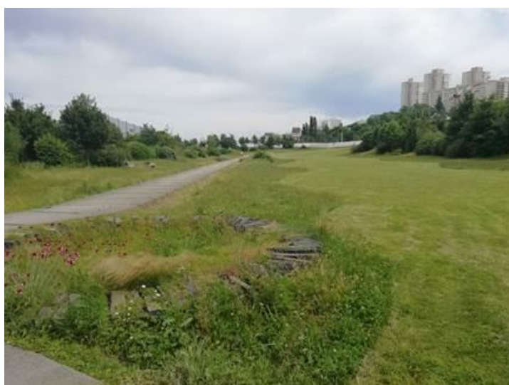
Parc des Guillaumes – Mise en place d'une fauche tardive, pour la première fois en 2019

Est Ensemble gère trois parcs reconnus d'intérêt territorial : le bois de Bondy, le parc des Beaumonts à Montreuil, et le parc des Guillaumes à Noisy-le-Sec. L'établissement ambitionne de développer une gestion exemplaire de ces espaces verts. En 2019, la gestion dite « différenciée » a été perfectionnée : valorisation du bois d'élagage, zones de fauches tardives, expérimentation en fauche précoce, mise en place de suivi de la gestion des prairies, via des protocoles de sciences participatives du Museum National d'Histoire Naturel, etc.