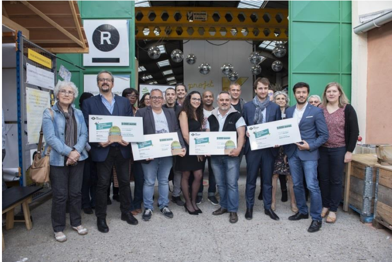
Les équipes des 4 entreprises lauréates des premiers Trophées de l'économie verte.