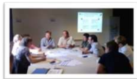
Atelier territorialisé à Bobigny

Au total, ce sont près de 450 citoyens d'Est Ensemble qui ont pris part à la concertation mutualisée à travers ces différents rendez-vous.