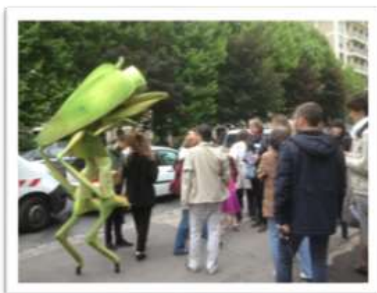
Semaine du développement durable à Pantin

Au total, ce sont près de 450 citoyens d'Est Ensemble qui ont pris part à la concertation mutualisée à travers ces différents rendez-vous.