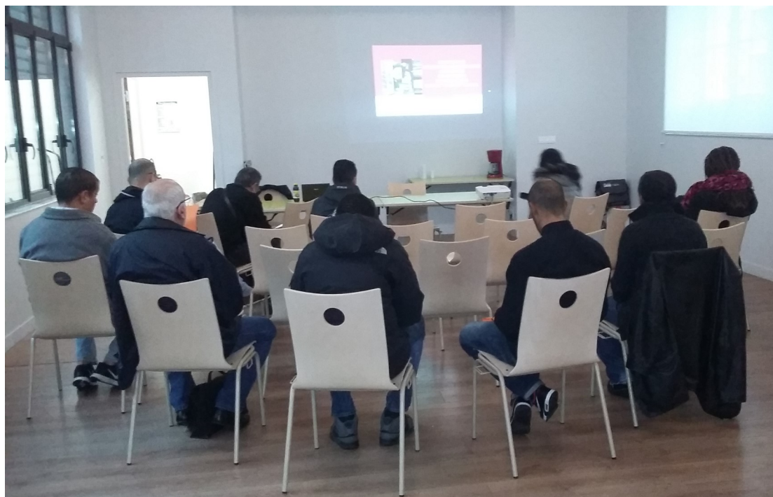
Réunion d'information—Accès à la Passerelle-Entreprise Gardien d'immeuble.

Volet communication : cf. notice Modalités de communication sur le financement du FSE, en direction des participants et des partenaires.