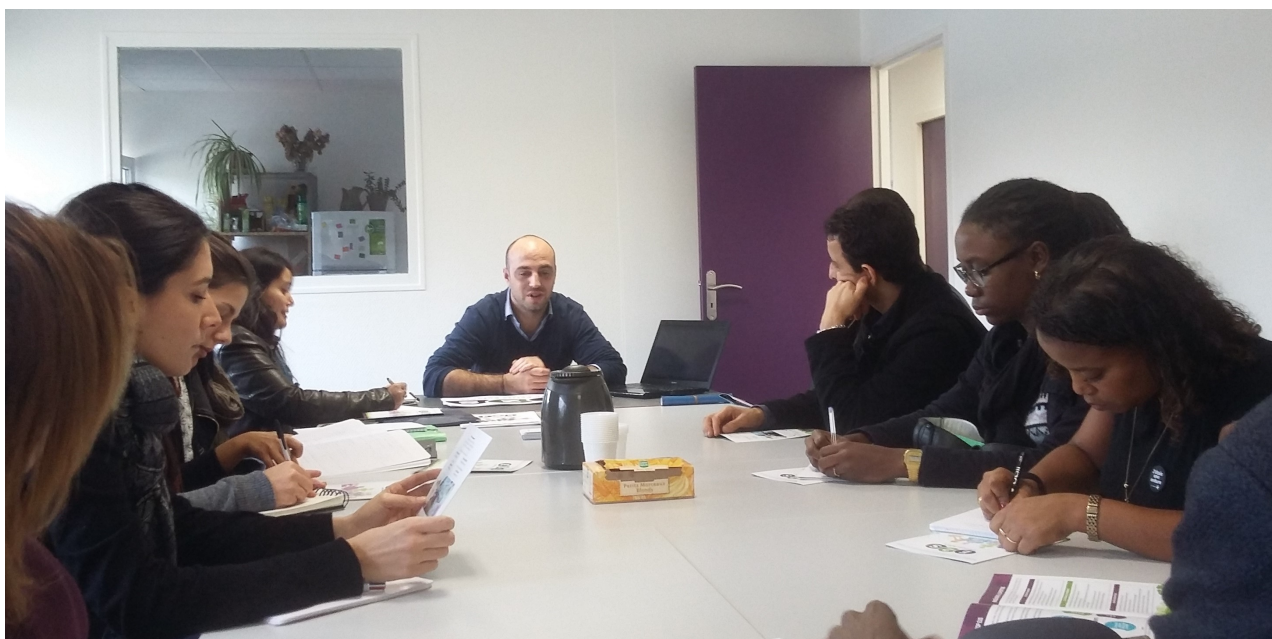
Visite de E2S Développement, La Collecterie, Le Sens de l'Humus et l'Épicerie sociale Aurore de Montreuil - 13 novembre 2015.

Volet communication : cf. notice Modalités de communication sur le financement du FSE, en direction des participants et des partenaires.