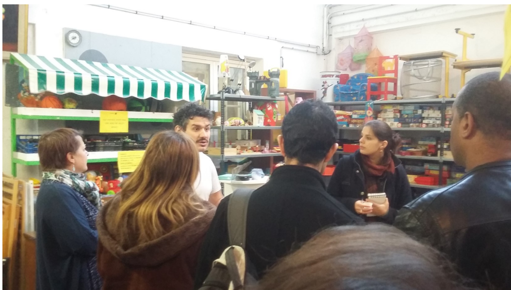
Visite de La Collecterie—novembre 2015.