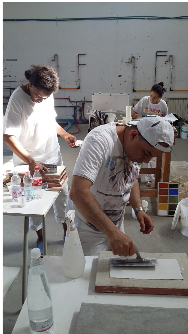
Chantier d'insertion Urban déco– juillet 2015