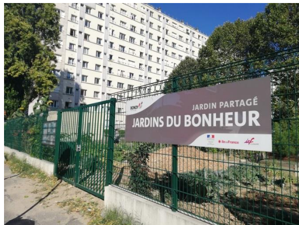
Jardin partagé « Jardins du bonheur »