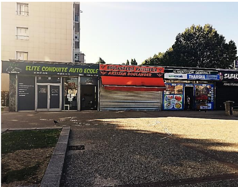
Local « boulangerie pâtisserie »

Annexe 1 : fiche technique, occupation temporaire local commercial, 138 route de Villemomble à Bondy.