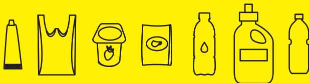
Emballages, bouteilles et flacons en plastique