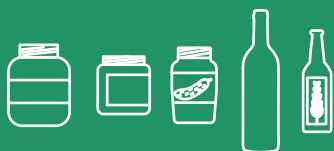
Bouteilles, bocaux et pots en verre sans couvercle