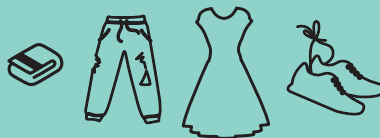
Vêtements, sacs, linge de maison, chaussures

Un doute sur les consignes ? Consultez :