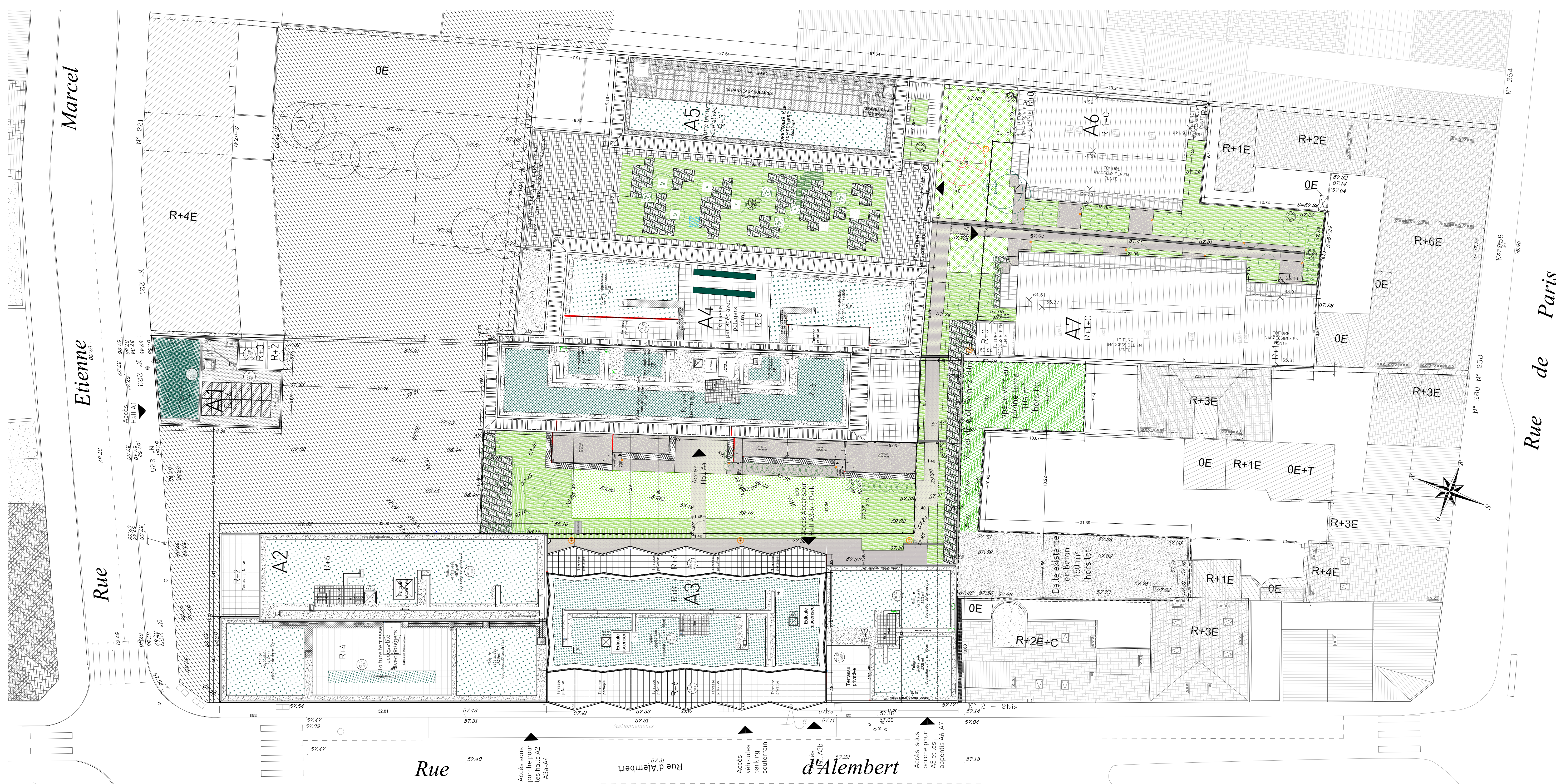
Plan de masse - 1/200°