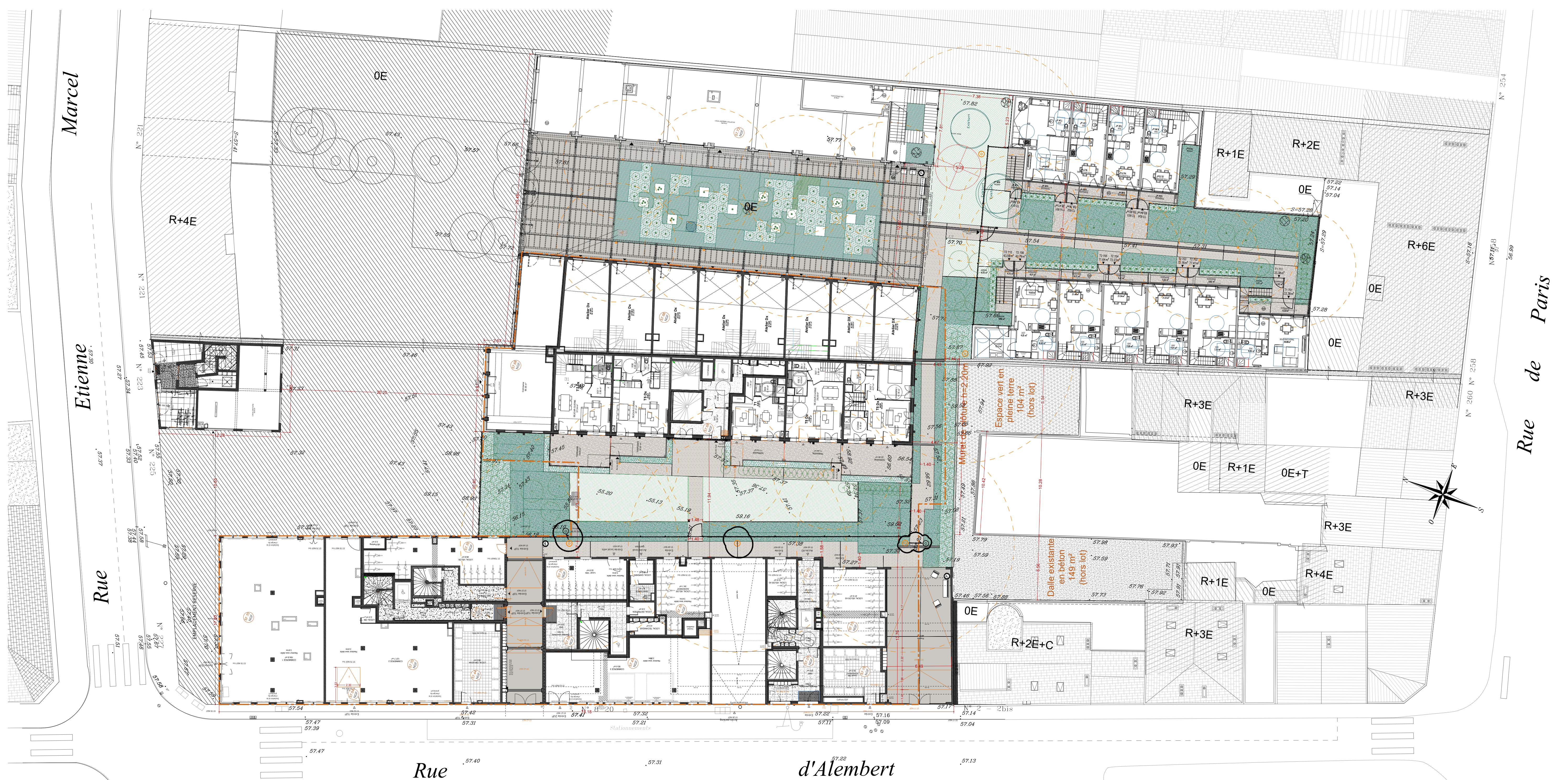
Plan du RDC - 1/200°