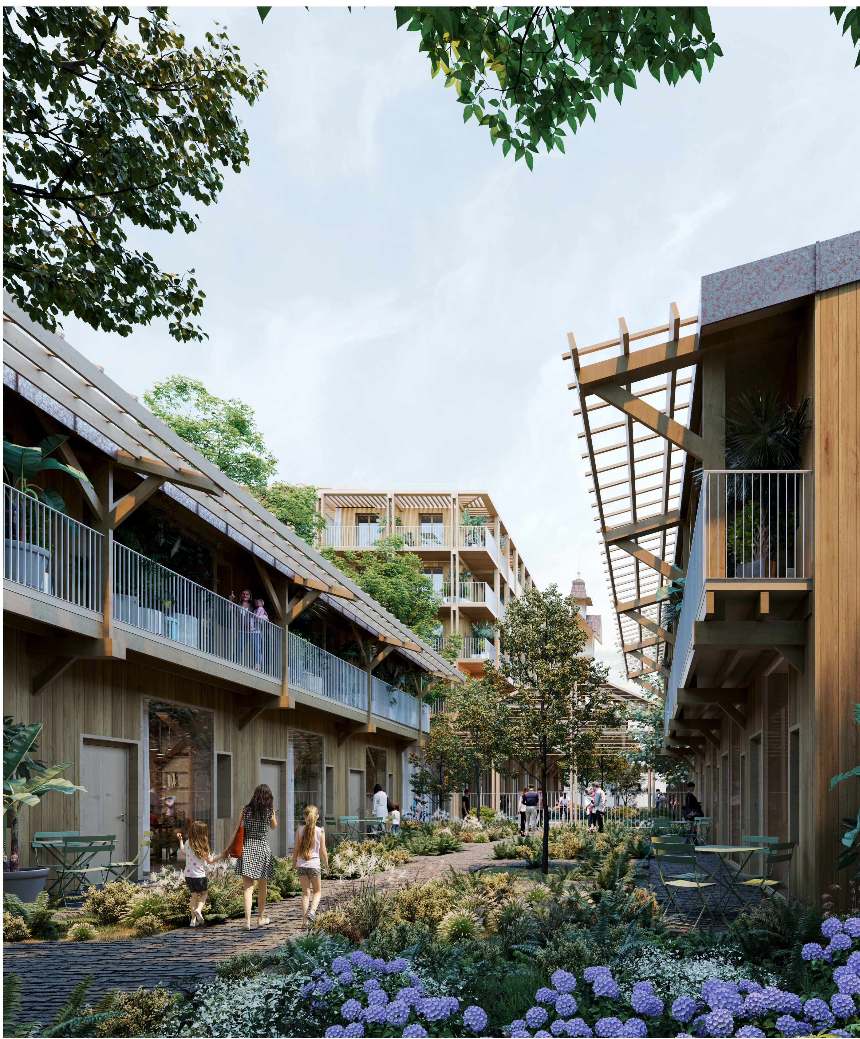
Vue intérieures des bâtiments A6 et A7 - Vue perspective