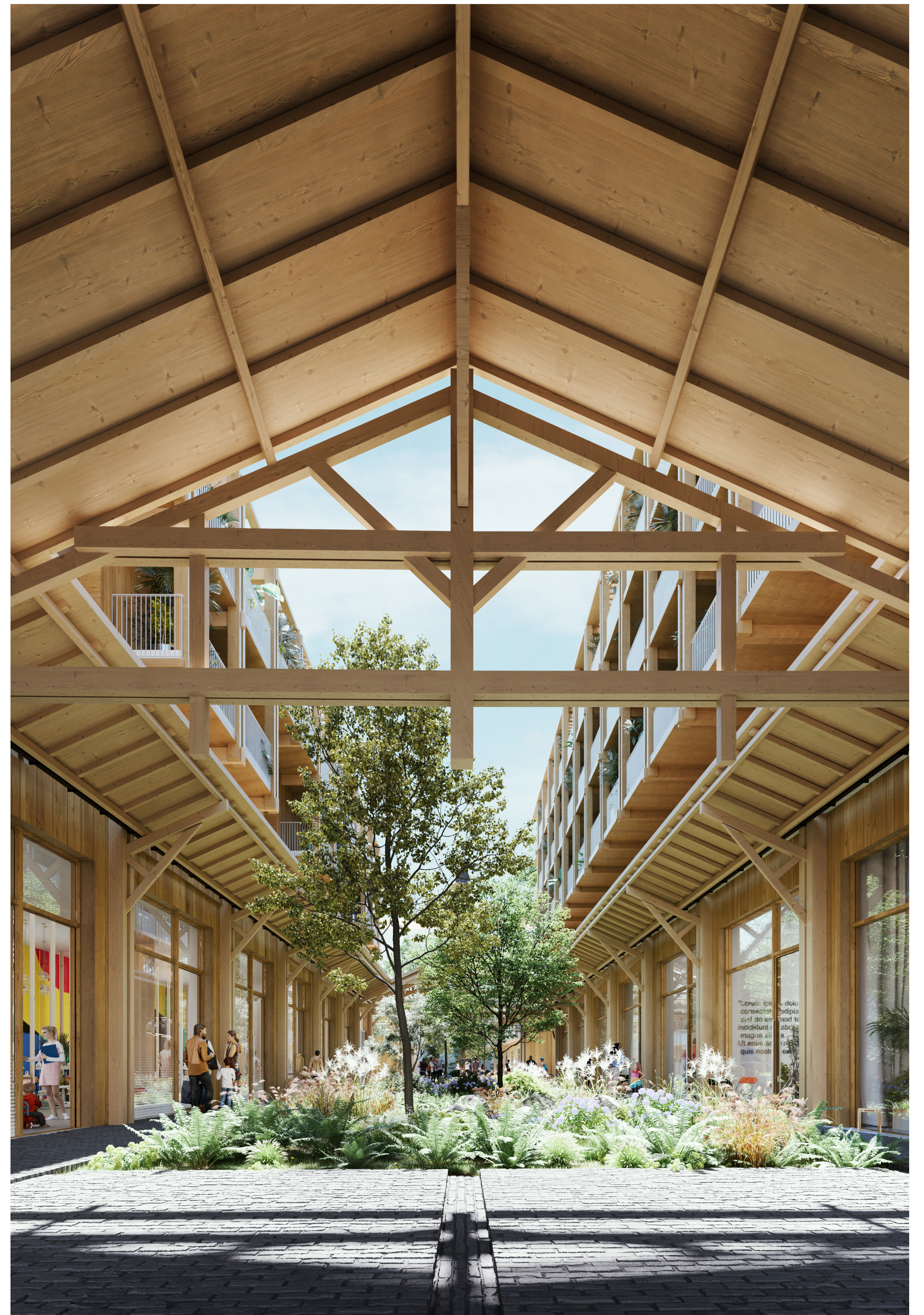
Vue intérieure de la halle - 1/200°