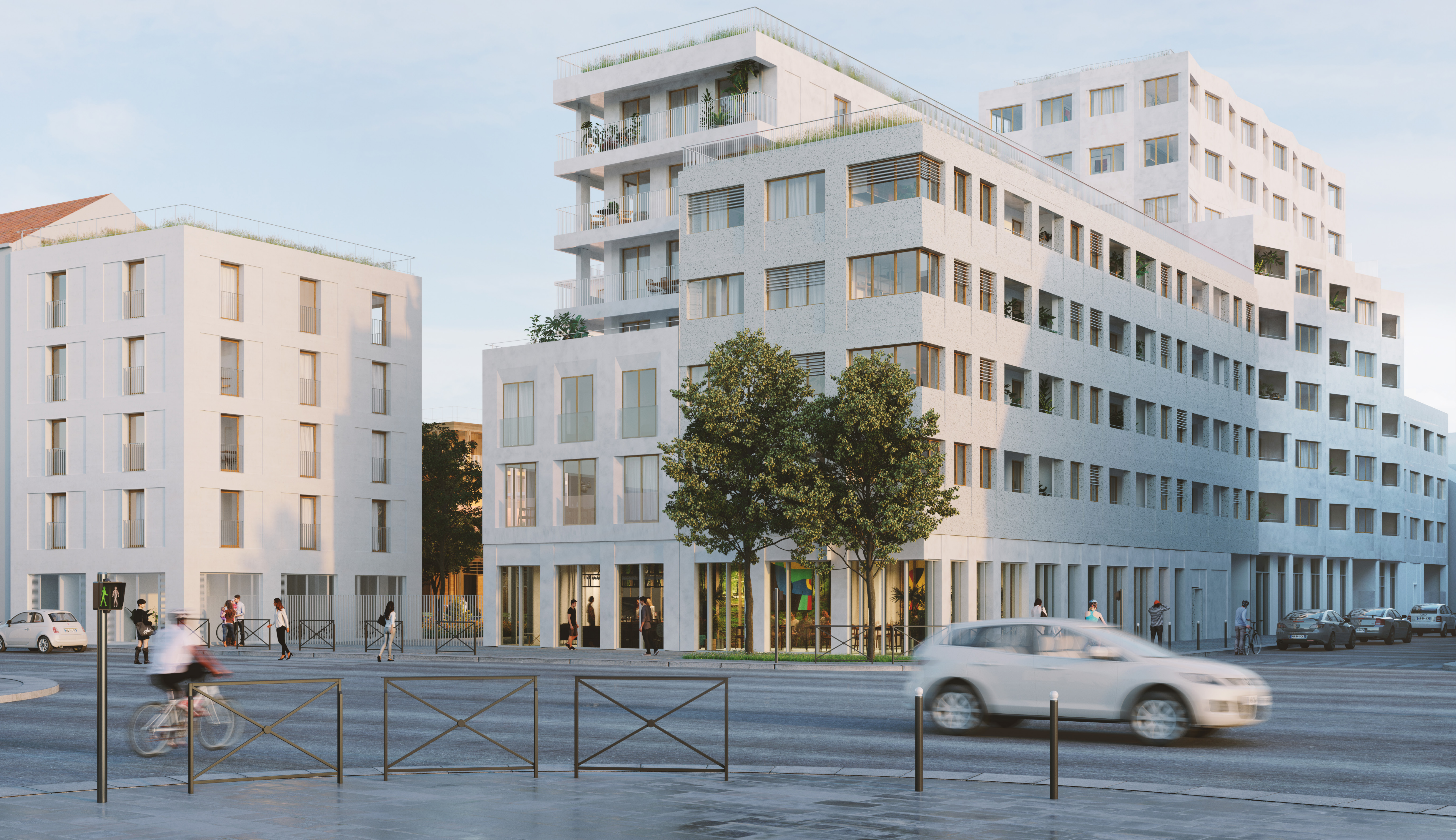
Vue depuis l'angle des rues Etienne Marcel et D'Alembert - Vue perspective