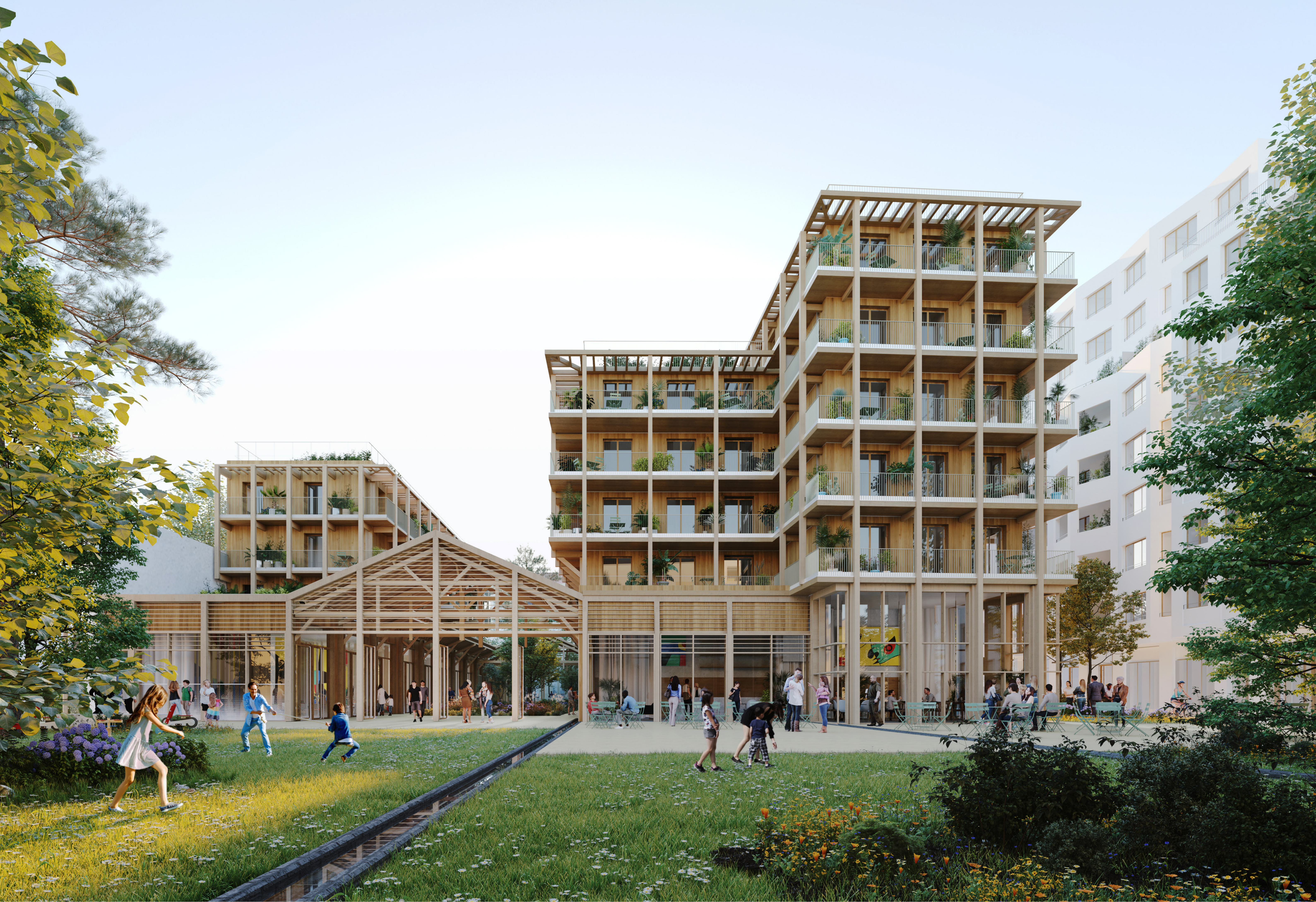
Vue depuis le futur jardin public - Vue perspective