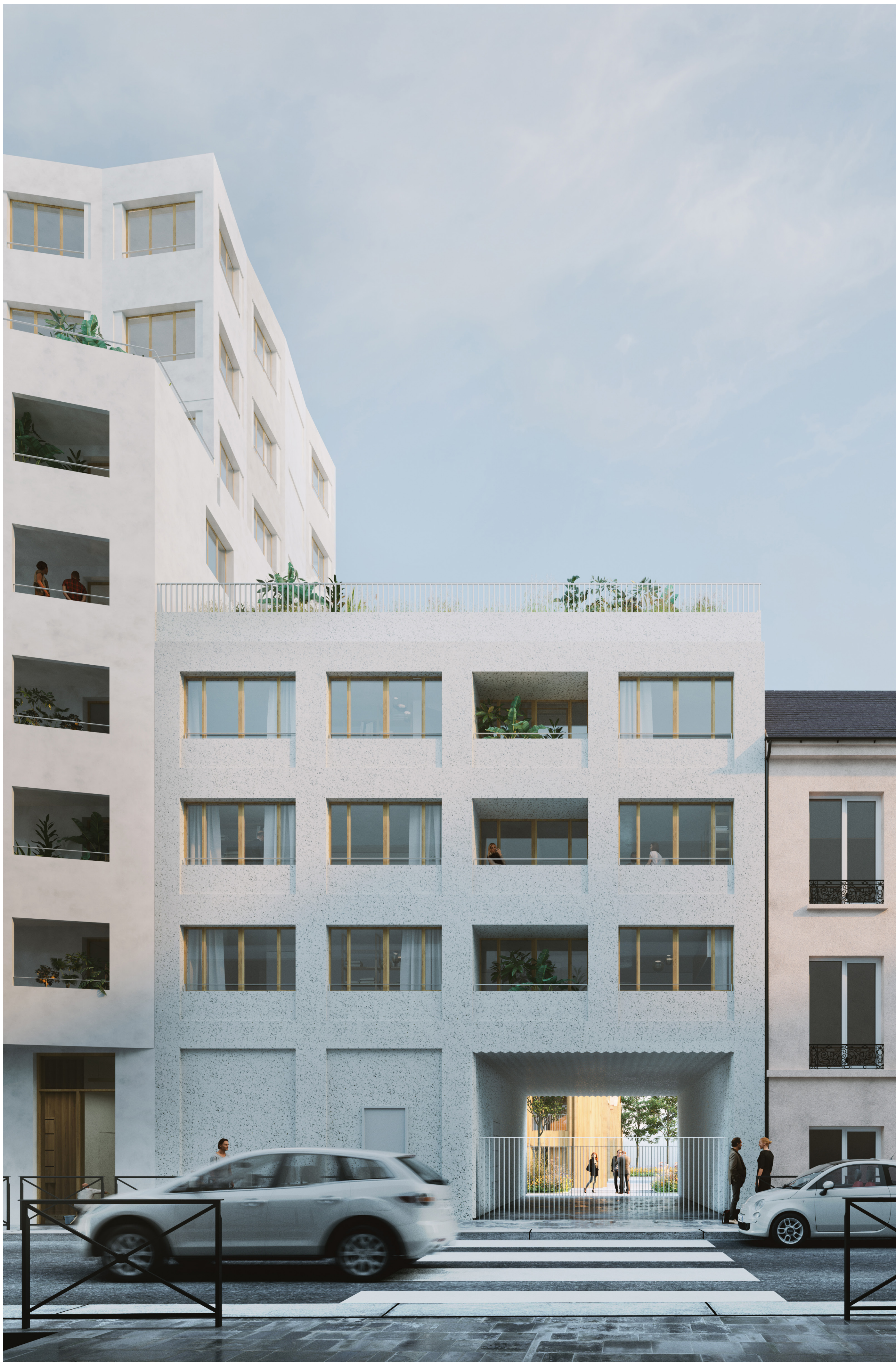
Vue du porche sous le bâtiment A3 depuis la rue D'Alembert - 1/200°