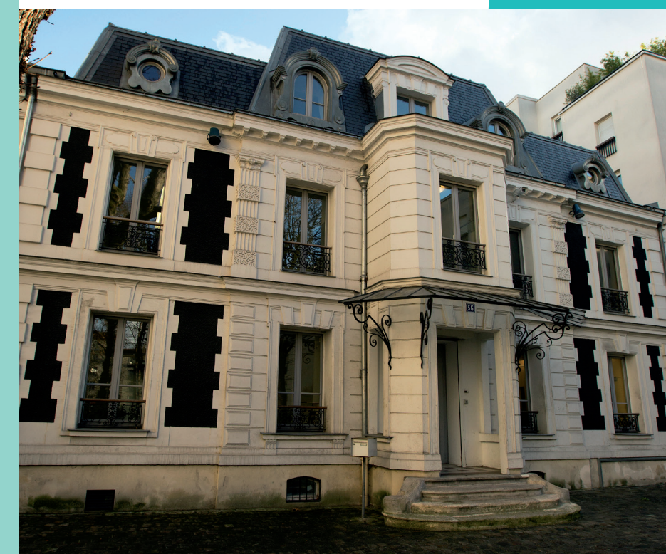
Maison Revel à Pantin

PROGRAMME EST ENSEMBLE www.est-ensemble.fr/jema2014